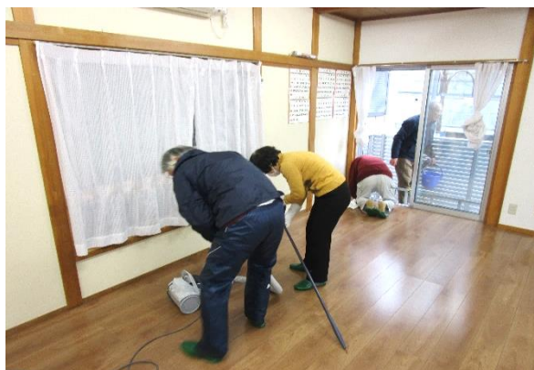
自治会館大清掃の様子(2階会議室)