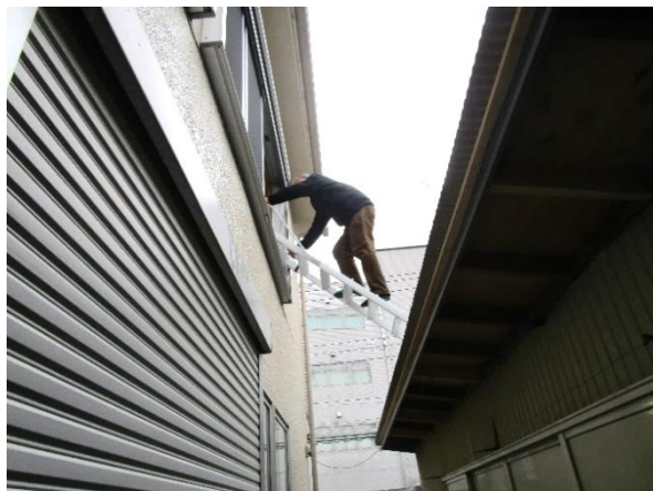
避難梯子取扱い確認の様子(梯子での避難2)