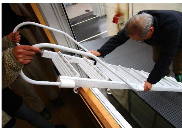
避難梯子取扱い確認の様子(梯子での避難1)