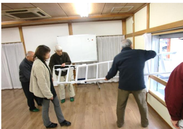
避難梯子取扱い確認の様子(梯子の設置)