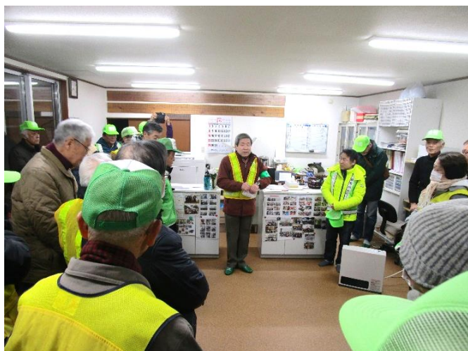
年末夜回りの様子(出発前岡庭会長挨拶)