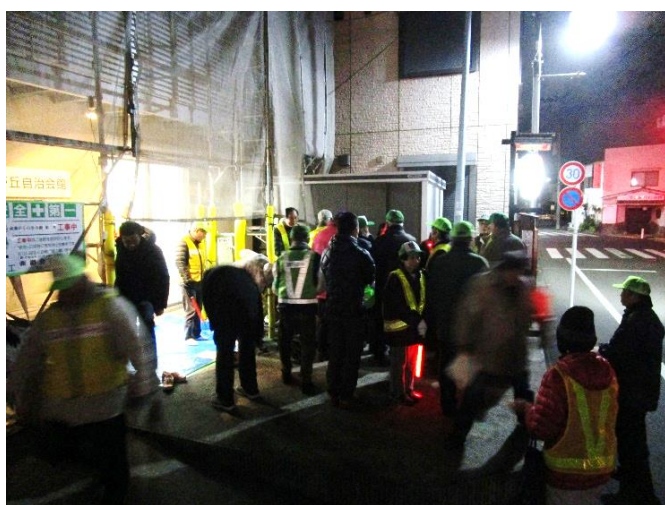
年末夜回りの様子(機材装備)