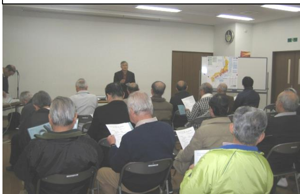
12月11日「出張防災講演会」－「いつか来るその時」

各丁目児童公園の清掃日 一月十五日(日) 九時から 雨天の場合は 二十二日(日)九時から みなさまのご協力を よろしく お願いいたします