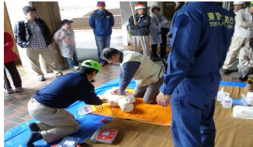
☆参加されたみなさんの真剣に取り組む、総合防災訓練の様子☆