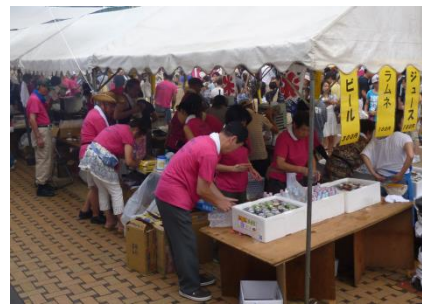
模擬店の裏は大いそがし

このほかにも、キッズダンスコンテスト、ロックライブ、歌謡ショーなどが催されました。