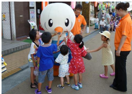
ゆりーとくんとふれあう子供たち