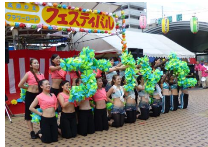
玉学大「ジュリアス」の皆さん