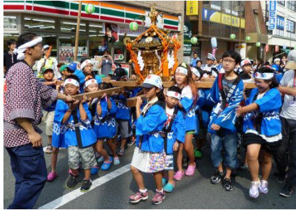
子供みこしだ！ワッショイ！