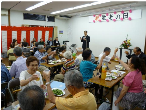
♪土川厚生部長による乾杯