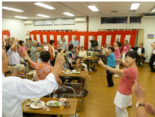
♪なごやかな敬老祝賀会の様子