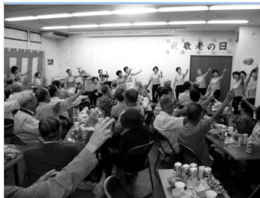
みんなで健康体操で和気あいあい