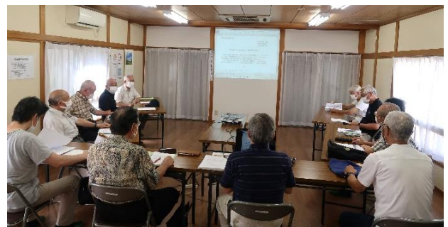
ホームページ開設委員会の様子