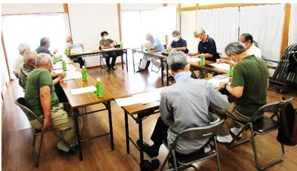
自主防災リーダー会議の様子