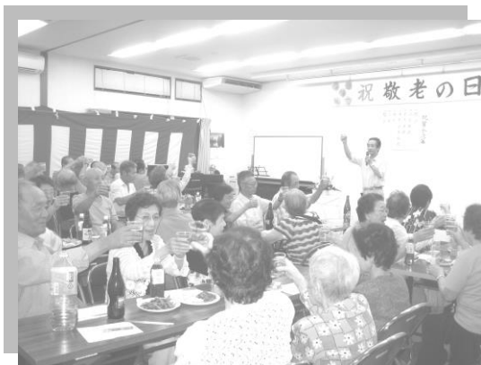
みなで乾杯！ 敬老祝賀会