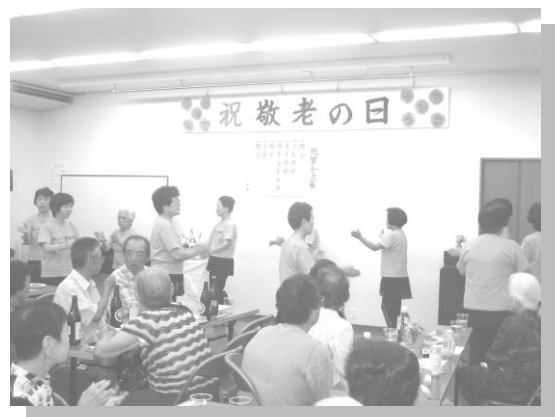
洋寿会のみなさまによるダンス