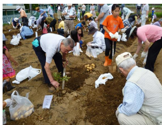
（6月30日芋ほり会の様子です）