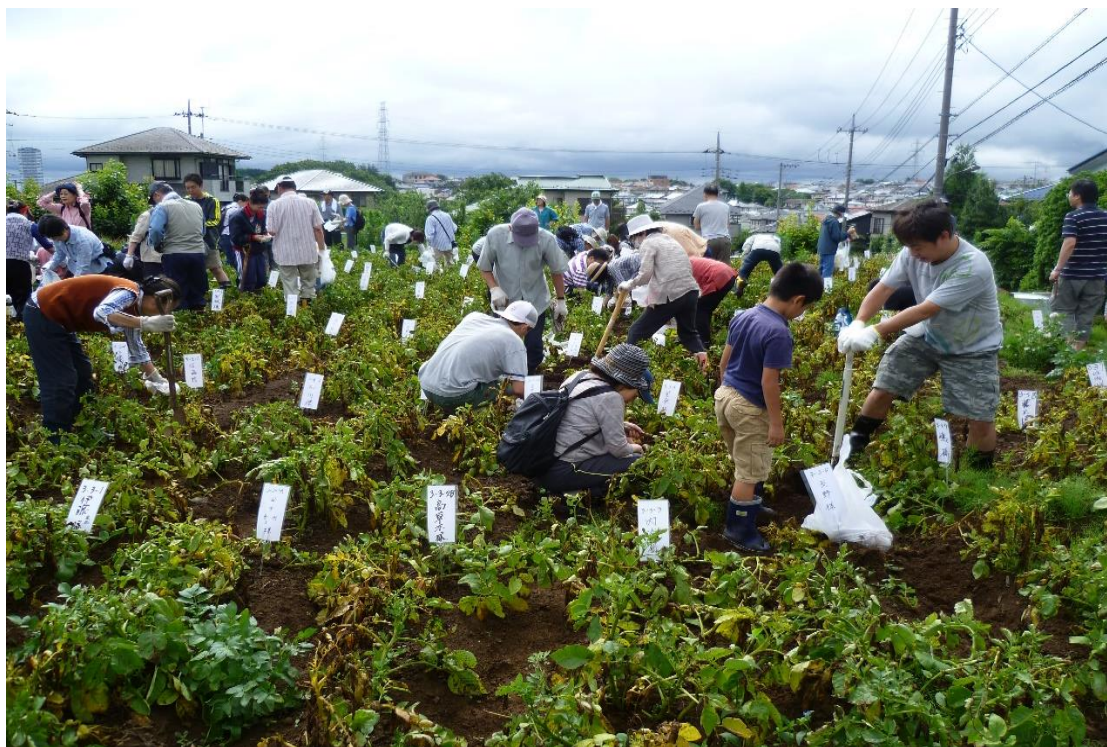
（6月29日じゃがいも掘り会の様子です）