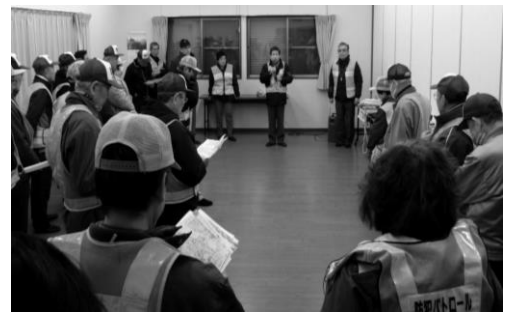
巡回前の説明を熱心に聞く参加者