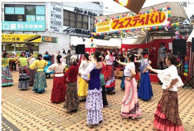
万舞 「マジャフラメンコ」