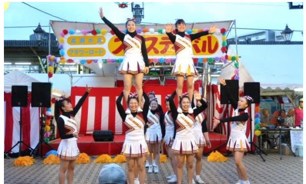
桜美林大学 「THREE NAILS CROWNS」