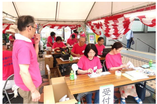
本部席 受付係 忙しくなるぞ!