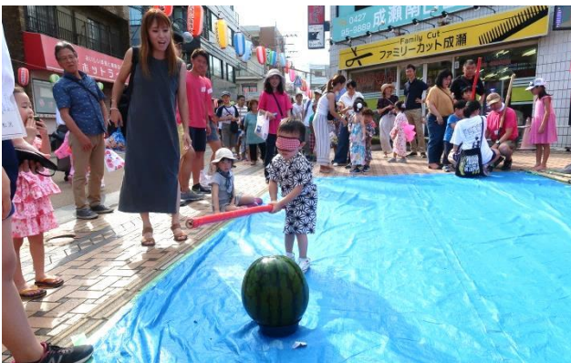
「スイカ割り」 そこだ、残念!