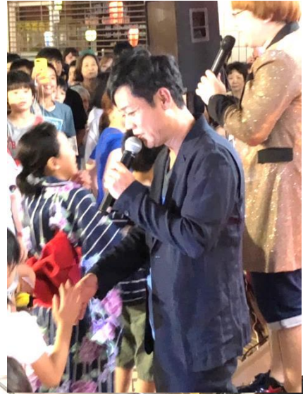
「名倉潤」(ネフチューン)