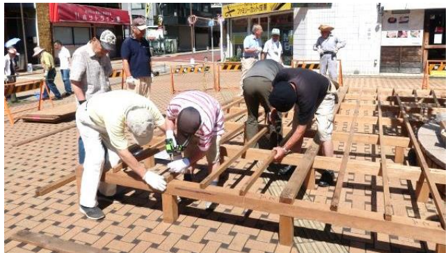
7/26(金) 「ステージ作り」(前日)