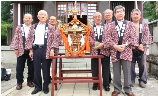
7/21(日) 「御神輿御霊祈願」

7月27日(土)、28日(日) 成瀬駅南口バラの広場にて「第22回フワロードフェスティバル」を開催しました。その準備から当日までの写真を紹介します。実行委員会では毎年新しい委員を募集しています。来年はあなたも参加しませんか。ご協力ありがとうございました。