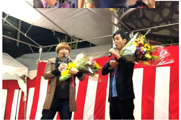
「ジニー堤」と「名倉潤」