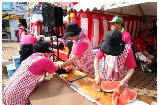
スイカを切って 甘くておいしいよ!