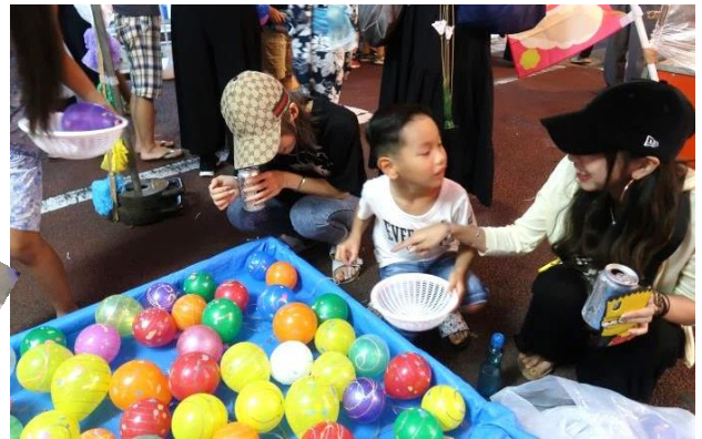
ヨーヨー いっぱい取ってよ!