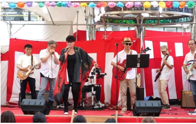
シンガーソングライター「彩シヨル」