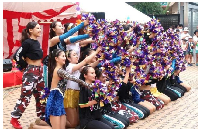
玉川大学ダンス部 リーダーズ 「ジュリアス」