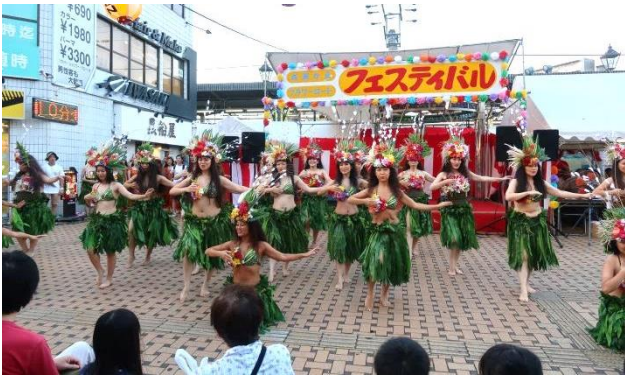
タヒチアンダンス 「ORIMANA」