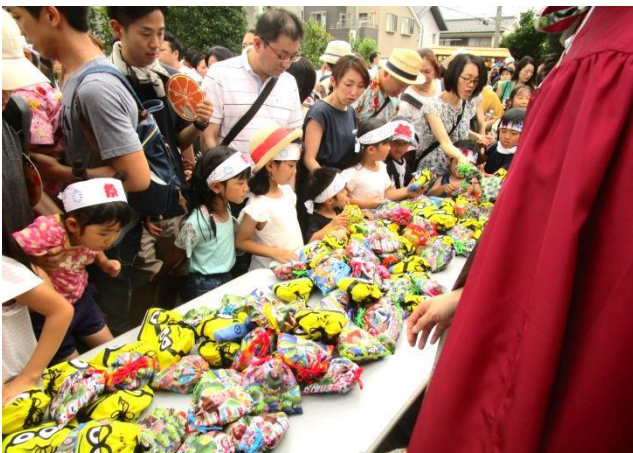
「子供みこし」休憩所 (カイセ工業)