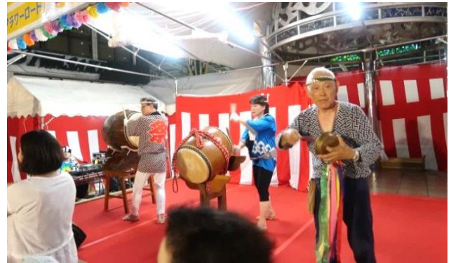
盆踊りの「鉦・太鼓チーム」盛り上がってます！