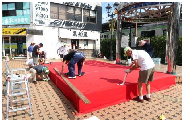
7/29(月) 会場後片付け ご苦労様でした！