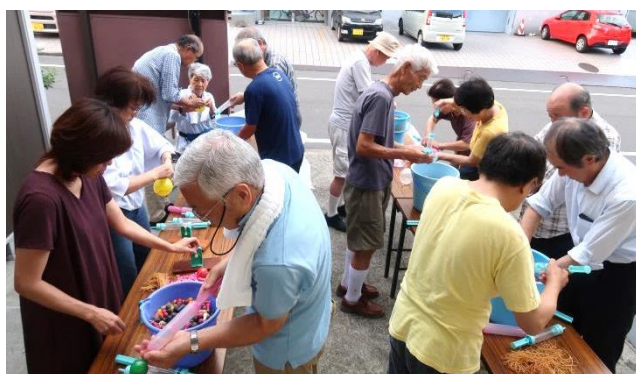
7/26(金) 「ヨーヨー作り」(前日)