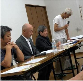
7/8(月) 「FRF 実行委員会」