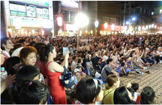
会場は人でいっぱい