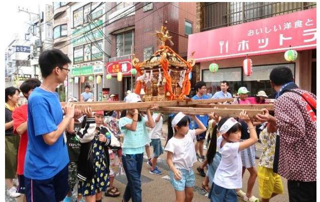
「子供みこし」ワッショイ!