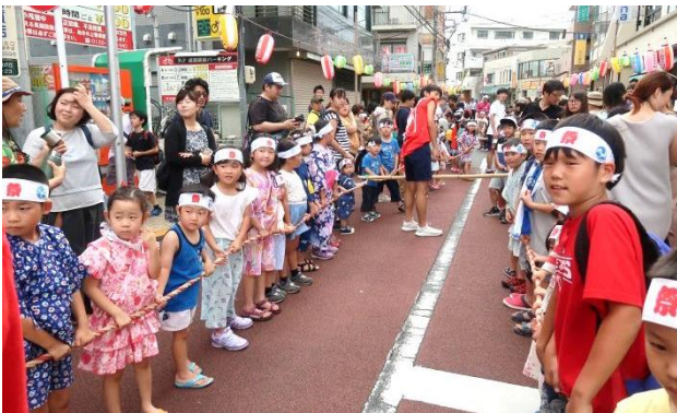
お祭り開始「子供みこし」出発!