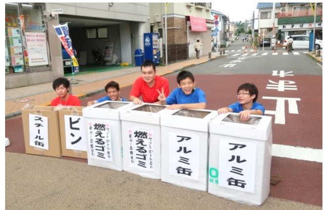
「資源物・ゴミ」回収コーナー (小川高校生)