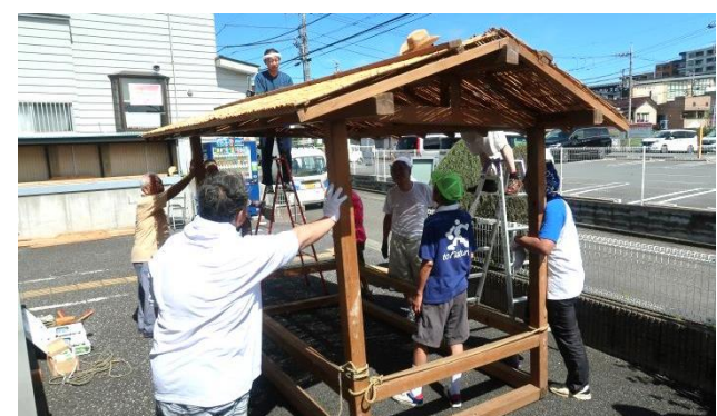
7/27(土) 「山車の組立」(当日朝)