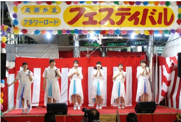
「まちだガールズ・クワイア」