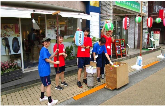
「お祭り提灯」取付 (小川高校生)