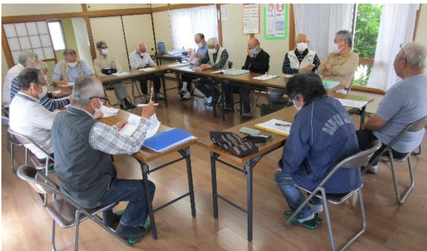
自主防災リーダー会議の様子