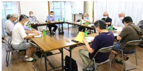
第3回なるせがおかアート展企画・実行委員会の様子