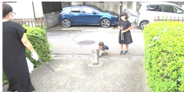
1丁目公園清掃の様子