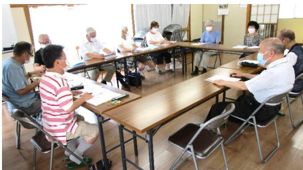
自治会館管理部臨時管理部会の様子