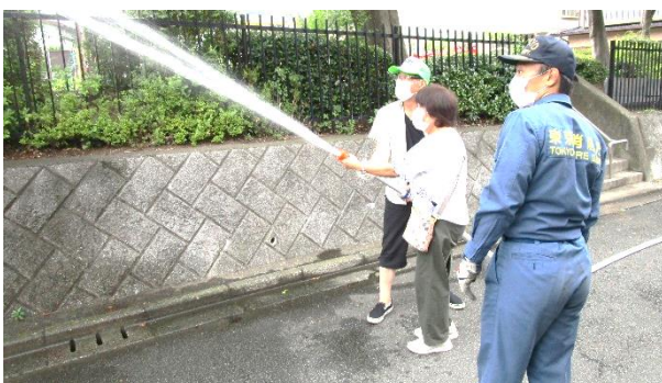
スタンドパイプ取扱い訓練の様子