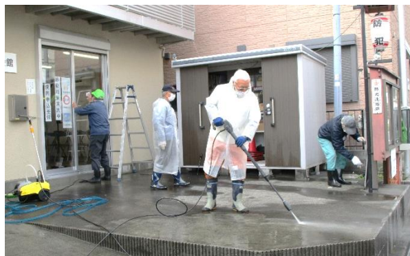
自治会館大掃除の様子