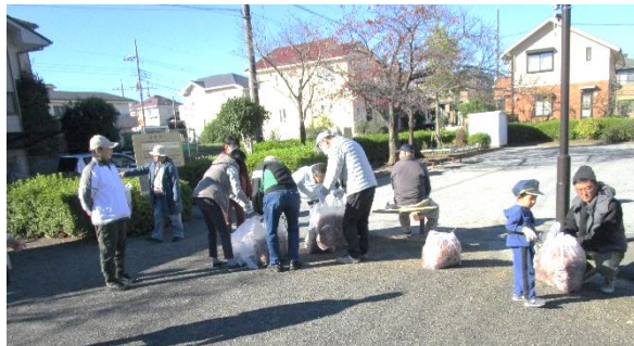
1丁目公園清掃の様子