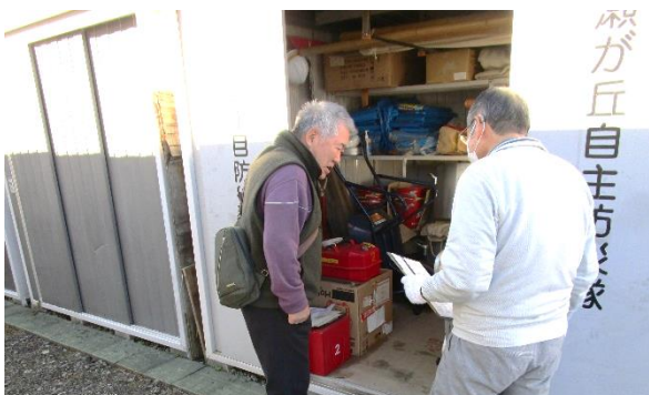
2丁目防災倉庫資機材点検の様子