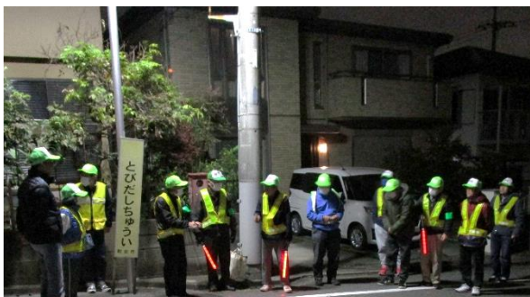
3丁目4班防犯パトロールの様子