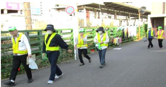
2丁目1区1G 防犯パトロールの様子