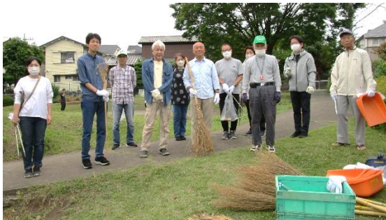
3丁目公園清掃の様子