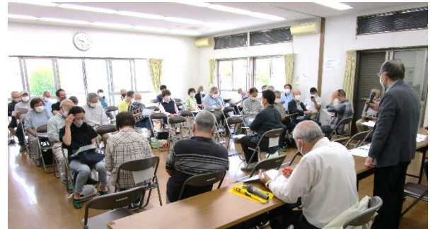
自主防災部・防犯交通部合同全体会議の様子