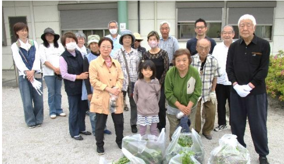
2丁目公園清掃の様子