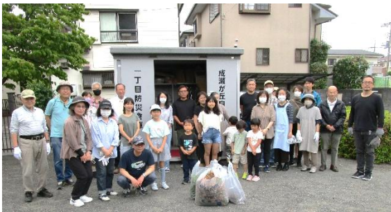
1丁目公園清掃の様子