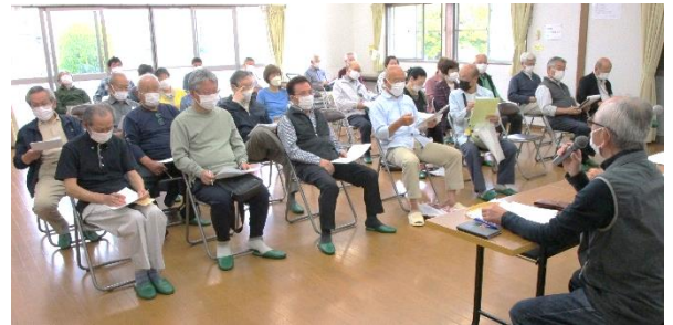
防犯推進委員会の様子