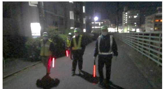
1丁目1Gr 防犯パトロールの様子