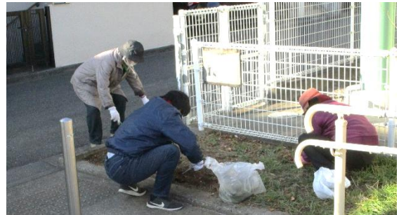
2丁目公園清掃の様子